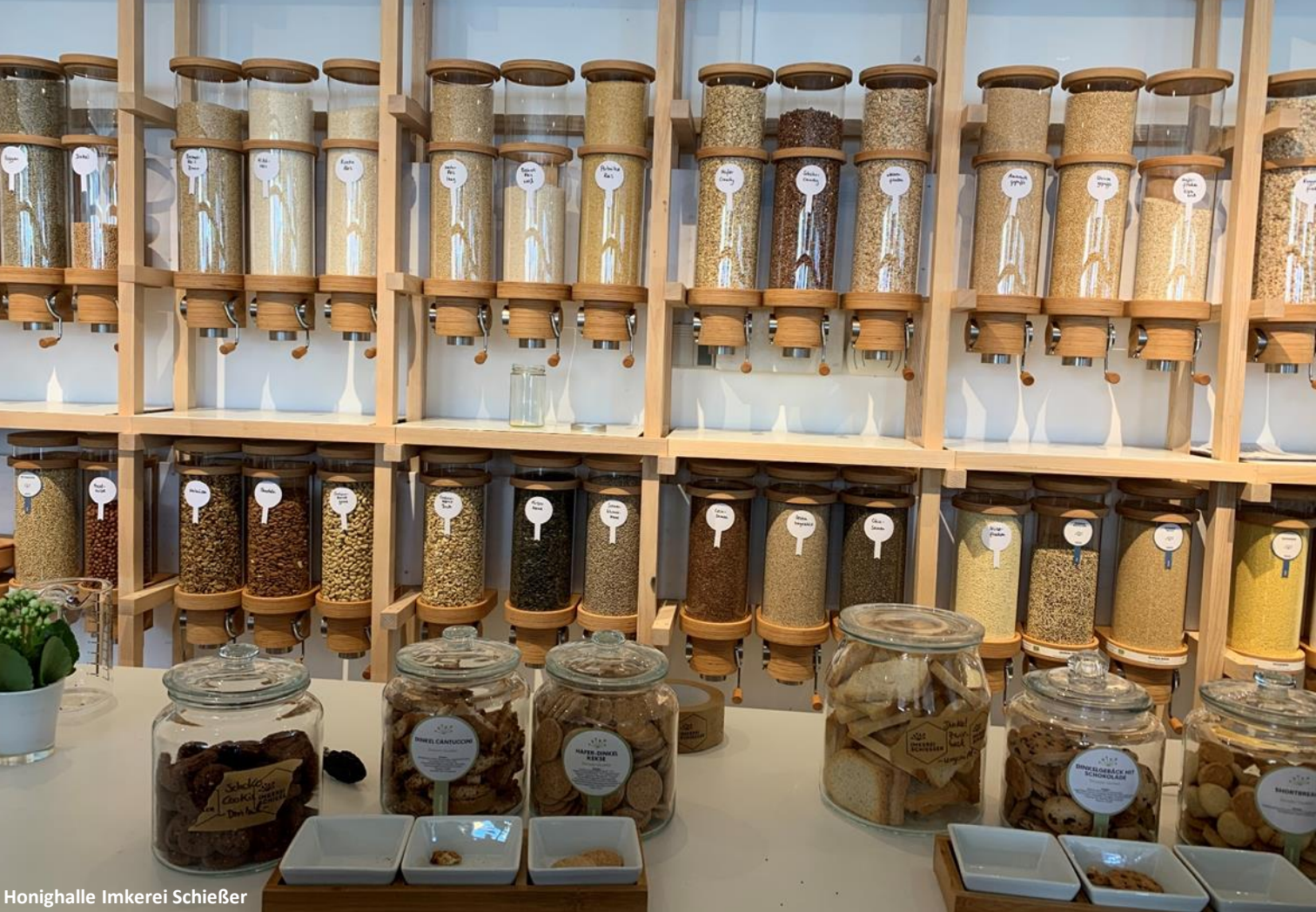
Honighalle Imkerei Schießer