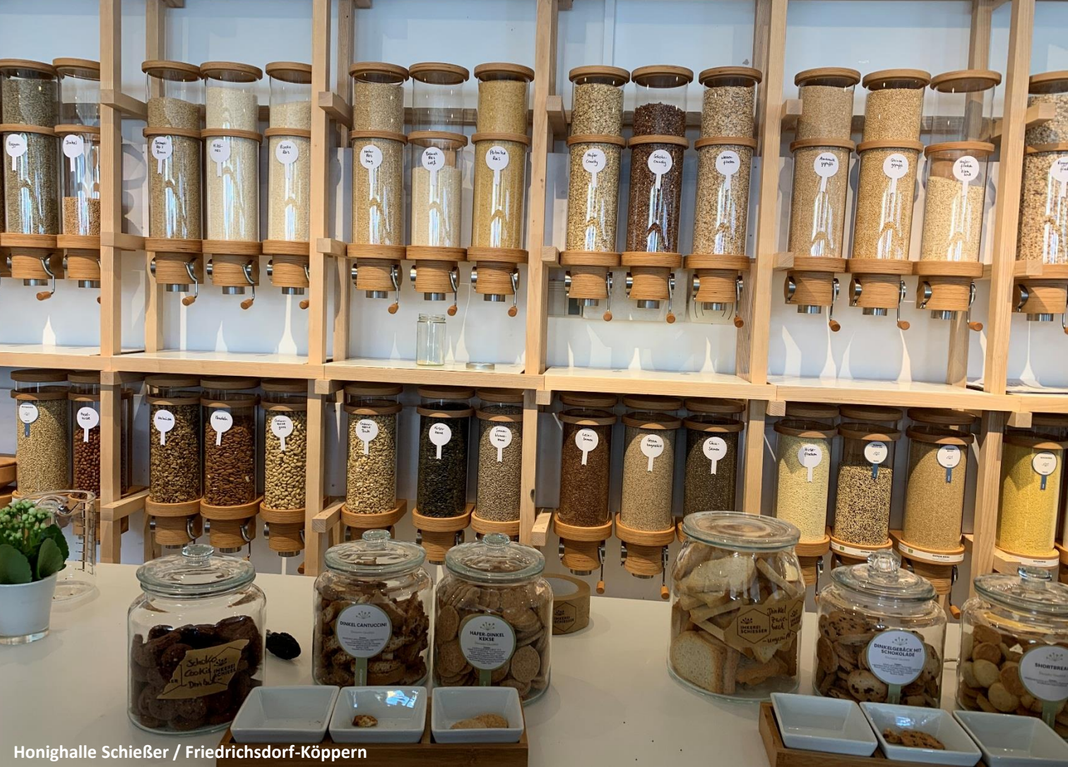
Honighalle Schießer / Friedrichsdorf-Köppern